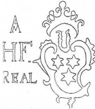
Abb. 3: Wasserzeichen des „Wallersteiner Konzerts“

einziges der Manuskripte enthält ein Werk eines Hofkomponisten; 15 von Joseph Haydn findet man dagegen Abschriften zweier seiner Sinfonien (Hob. 1:44 und 1:90). Die auf besagtem Papier geschriebenen Manuskripte wurden anscheinend alle nach 1788 und wahrscheinlich vor 1793 angefertigt. Das gleiche Papier findet sich auch in verschiedenen anderen Sammlungen bei Musik von Joseph und Michael Haydn. Alle diese Manuskripte sind in dieselbe Zeit zu datieren. Es ist also anzunehmen, dass das „Wallersteiner Konzert“ irgendwann nach 1788 kopiert worden ist, und dass dies höchstwahrscheinlich nicht in Wallerstein geschah.